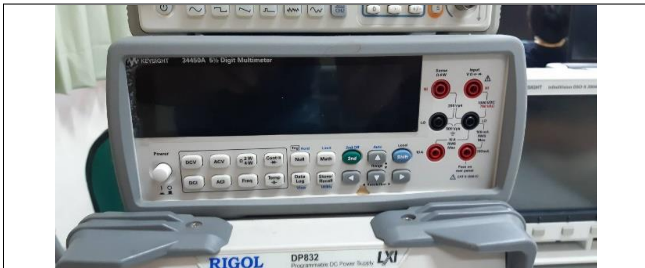
桌上型三用電錶（型號：Keysight 34450A）